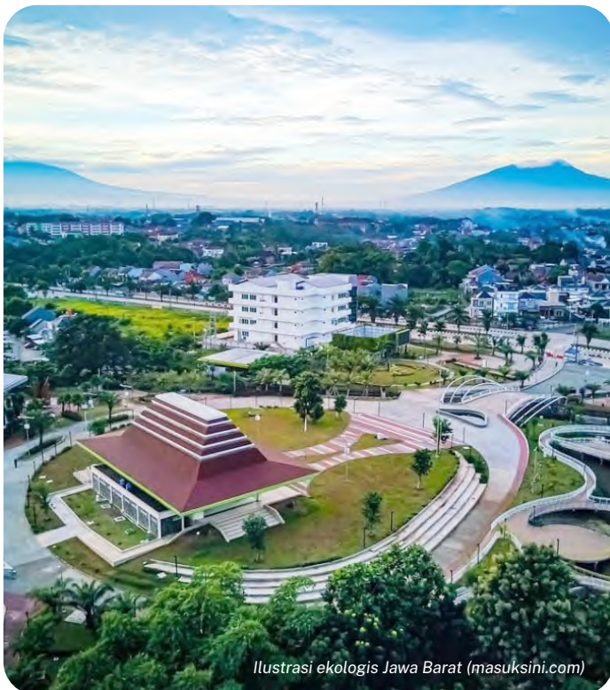
Ilustrasi ekologis Jawa Barat